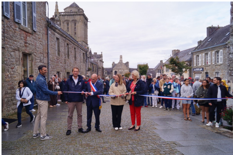
Inauguration des embellissements de Locronan