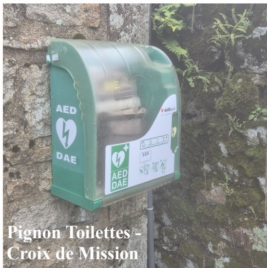
Pignon Toilettes - Croix de Mission

DÉFIBRILLATEURS - Dans le souci constant d'assurer la sécurité de tous, habitants comme visiteurs, la commune a déployé neuf défibrillateurs automatisés externes (DAE) sur l'ensemble du son territoire. Cette installation, à l'échelle d'un village de 800 âmes, traduit une volonté forte de protection et d'équité territoriale. Chaque secteur, du centre-bourg aux hameaux les plus éloignés, bénéficie désormais d'un accès rapide à un dispositif de secours vital. Ce maillage dense et équilibré répond à la spécificité de Locronan, à la fois rurale et touristique. Grâce à cette démarche, tous les habitants disposent aujourd'hui d'un équipement à proximité garantissant une prise en charge rapide en cas d'urgence cardiaque, renforçant ainsi la sécurité collective sur l'ensemble du territoire communal. Quelques stages d'utilisation des dispositifs seront organisés.