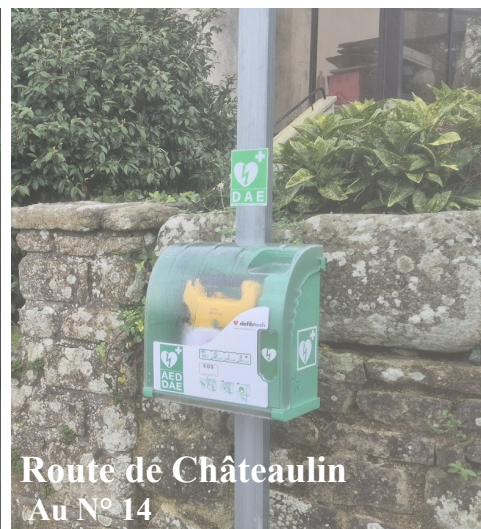
Route de Châteaulin Au N° 14