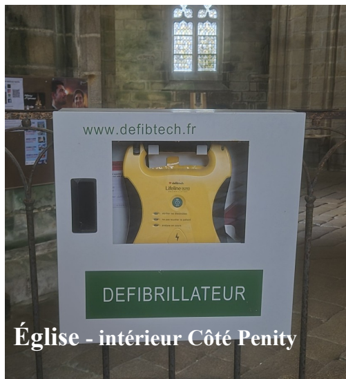
Église - intérieur Côté Penity