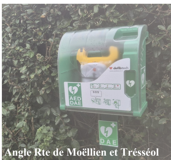
Angle Rte de Moëllien et Trésséol