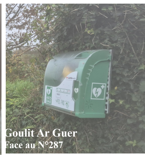
Goulit Ar Guer Face au N°287