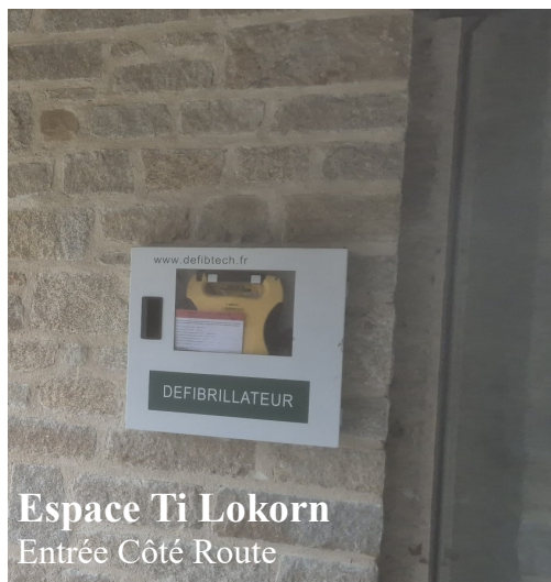
Espace Ti Lokorn Entrée Côté Route