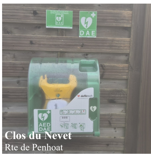
Clos du Nevet Rte de Penhoat