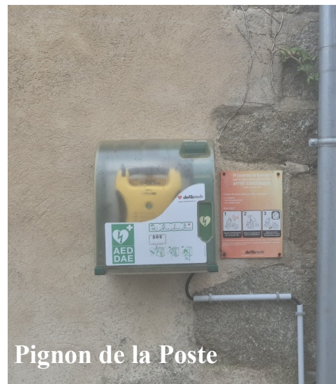
Pignon de la Poste