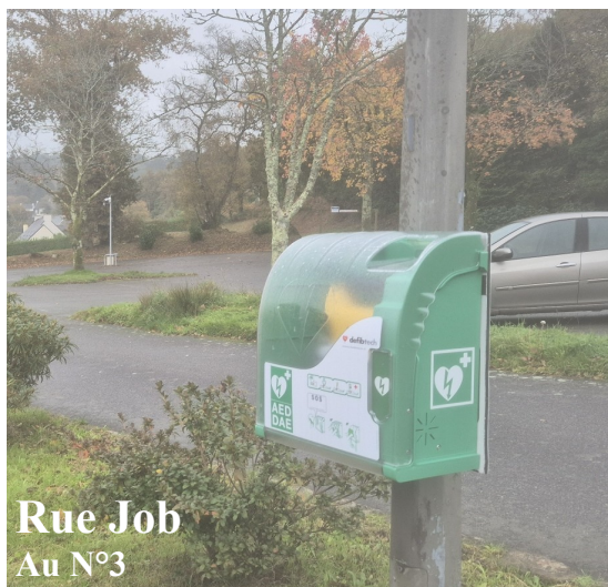
Rue Job Au N°3